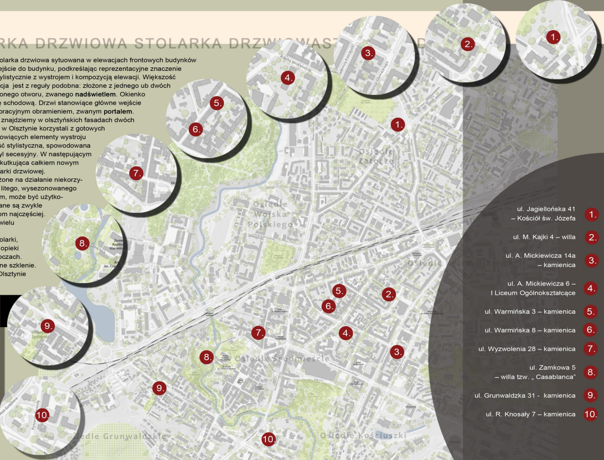
2. ul. M. Kajki 4 – willa

Te monumentalne wrota stanowią wejście do jednego z olsztyńskich kościołów. Wejścia do obiektów sakralnych od początku chrześcijaństwa miały znaczenie symboliczne i obfitowały w metaforyczne przedstawienia obrazujące przejście z sfery profanum do sacrum. Zagadkowe drzwi są dwuskrzydłowe, wykonane ze szlachetnego drewna dębowego, zabezpieczone jedynie transparentną politurą pozwalającą na wyeksponowanie usłojenia drewna. Nad skrzydłami znajduje się nadświetle wypełnione szybkami witrażowymi, osadzonymi w oliwianej ramie. Charakterystycznym elementem tych drzwi są metalowe okucia, zwłaszcza rozbudowane zawiasy pasowe w formie wici roślinnej, które oprócz funkcji dekoracyjnej, wzmacniają i usztywniają masywne skrzydła drzwiowe. Na zawiasach ukryte zostały także przedstawienia zagadkowych postaci, ale trzeba podejść bardzo blisko, aby je zauważyć.