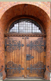
1. ul. Jagiellońska 41 – Kościół św. Józefa

Te monumentalne wrota stanowią wejście do jednego z olsztyńskich kościołów. Wejścia do obiektów sakralnych od początku chrześcijaństwa miały znaczenie symboliczne i obfitowały w metaforyczne przedstawienia obrazujące przejście z sfery profanum do sacrum. Zagadkowe drzwi są dwuskrzydłowe, wykonane ze szlachetnego drewna dębowego, zabezpieczone jedynie transparentną politurą pozwalającą na wyeksponowanie usłojenia drewna. Nad skrzydłami znajduje się nadświetle wypełnione szybkami witrażowymi, osadzonymi w oliwianej ramie. Charakterystycznym elementem tych drzwi są metalowe okucia, zwłaszcza rozbudowane zawiasy pasowe w formie wici roślinnej, które oprócz funkcji dekoracyjnej, wzmacniają i usztywniają masywne skrzydła drzwiowe. Na zawiasach ukryte zostały także przedstawienia zagadkowych postaci, ale trzeba podejść bardzo blisko, aby je zauważyć.