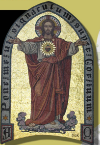
2. Kościół Najświętszego Serca Pana Jezusa przy ul. M. Kopernika

- mozaika z przedstawieniem Chrystusa nad głównym wejściem do kościoła