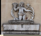
3. ul. T. Kościuszki 70 - Szkoła Podstawowa nr 2 (dawna szkoła ludowa im. Hindenburga)

W Olsztynie jest tylko kilka zabytków, w których ta technika została wykorzystana. Obraz widoczny na zdjęciu jest dziełem wysokiej klasy, o czym świadczy m.in. subtelne cieniowanie, odwzorzone na fałdowaniu szat Chrystusa. Utalentowany twórca mozaiki, malarz z Królewca - P. Gostek, pozostawił swój podpis w prawym dolnym rogu obrazu. Chrystus z gorejącym sercem, symbolem Bożej Miłości, przedstawiony został na złotym tle w ostrołukowym polu, okolonym łacińskim napisem: „Położ mnie jako znak na Twoim sercu”. U podstawy napisu znalazły się greckie litery alfa i omega, w symbolice chrześcijańskiej oznaczające Boga, który jest Początkiem i Końcem.